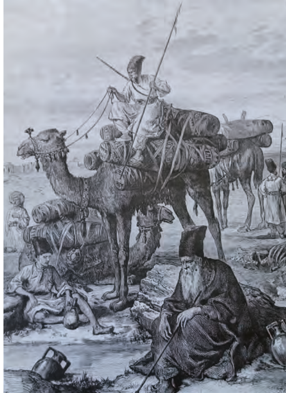
Traslado de restos mortales musulmanes de Kerbala a Meshid Ali. La Ilustración Española y Americana 22 de febrero de 1874.

Náyades. Ninfas griegas relacionadas con las fuentes, manantiales, arroyos, riachuelos, ríos pozos, pantanos, lagos. Tenían poder curativo. Si el lugar donde habitaban se secaba... , morían.