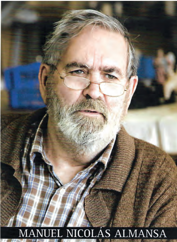
MANUEL NICOLÁS ALMANSA

1946; Retablo mayor de la iglesia de San Francisco , Ciudad de Guatemala, 1965; Estirpe de los mayas , 1981 ( Retablo mayor de la iglesia de Belén , Ciudad de Guatemala, 1989; Relieves para el sepulcro del Beato Hermano Pedro , iglesia de los franciscanos en Antigua, 1989; Monumental retablo con motivos mayas , iglesia de La Blanca de Ocos, 1998... 8 .