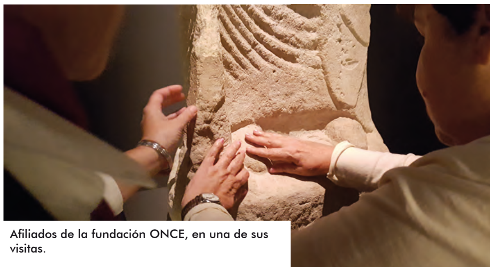
Afiliados de la fundación ONCE, en una de sus visitas.