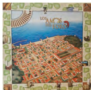
Juegos: Conquistando Imperios. Los Amos del Foro.