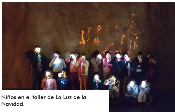
Niños en el taller de La Luz de la Navidad.