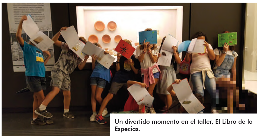
Un divertido momento en el taller, El Libro de la Especies.