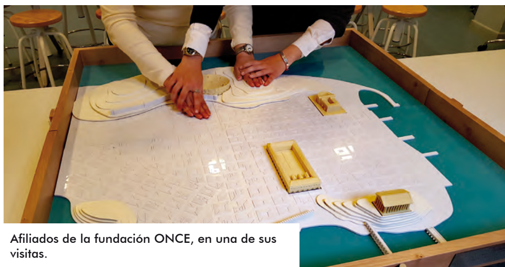
Afiliados de la fundación ONCE, en una de sus visitas.