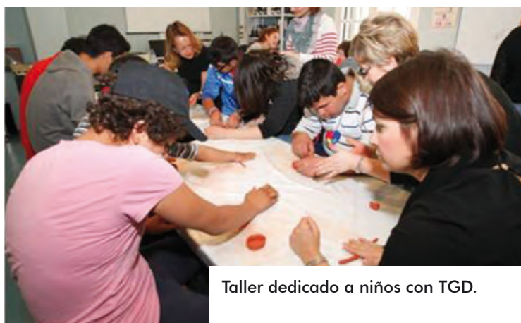
Taller dedicado a niños con TGD.