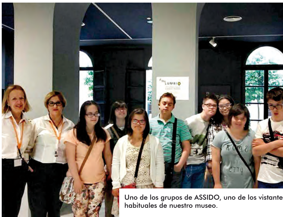
Uno de los grupos de ASSIDO, uno de los visitantes habituales de nuestro museo.