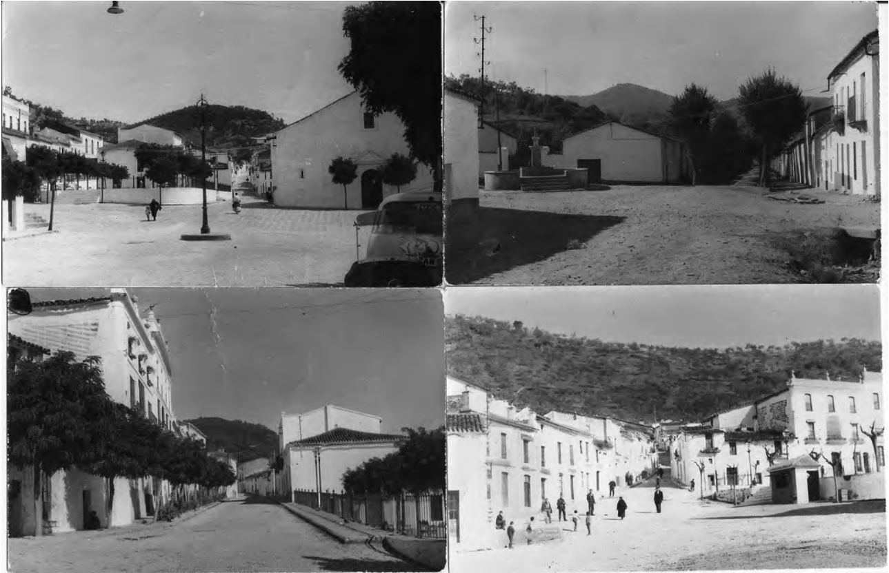
Rincones de Galaroza, Huelva. Postales impresas en 1967 en Cieza, coloreadas a mano.