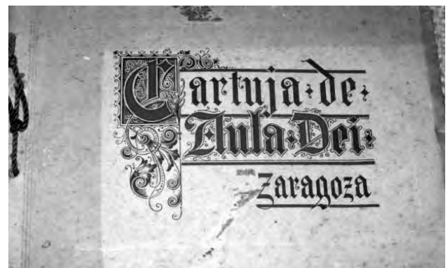
Álbum fotográfico de La Cartuja. 1935.

Previamente trabajó de tornero en Milán y en 1933 era el vicepresidente de la Asociación Patronal de Librería 1 .