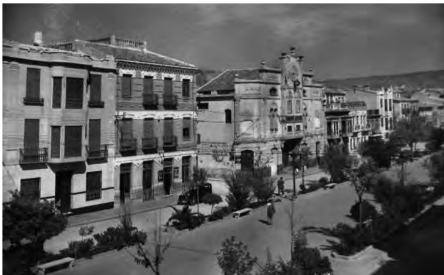
Paseo y Teatro Borrás. Cieza. Circa 1960. Casa Cesaraugusta.

Le empresa cerraría la empresa en 1978, por razones de salud de su único propietario en aquel momento. Antes de ello, trabajó para toda la geografía española y una gran cantidad de países de Hispanoamérica: