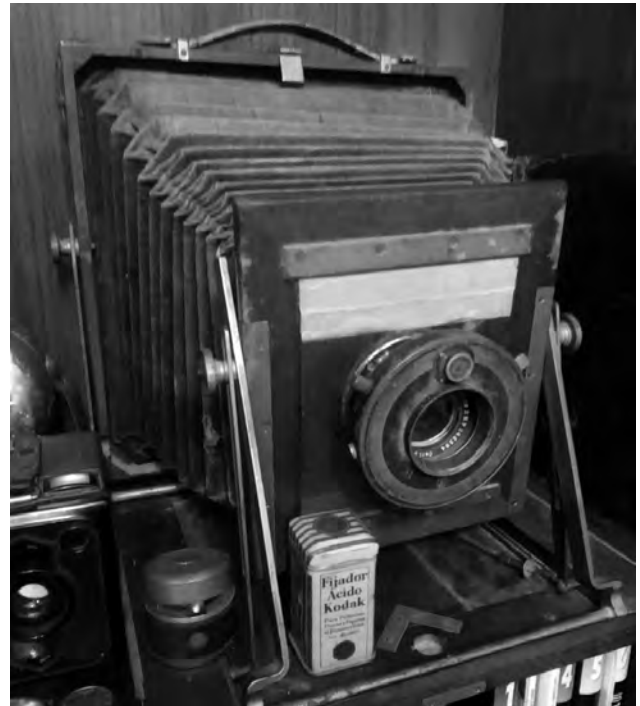
Cámara fotográfica de Casa Cesaraugusta.

En 1923 ya destaca como industrial y en febrero de 1933 le colocarían una bomba en la puerta de su casa para amedrentarle pero, afortunadamente, no estalló. En 1936 sería detenido tras la victoria del Frente Popular en las elecciones 3 .