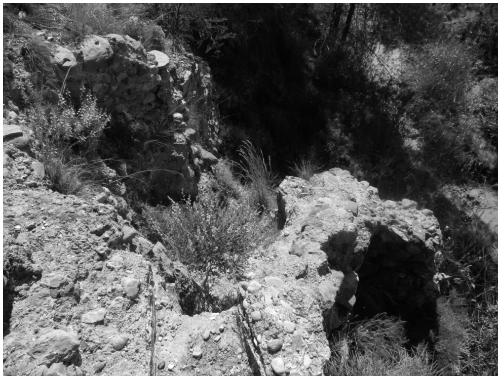
Figura 7: Caz y cubo del Molino de La Murta

zación que abastecía la balsa de la población. Del mismo modo, señalan que ya en el siglo XX parte de la población iba a moler al molino eléctrico de Corvera e incluso que algunos de los vecinos de la localidad iban al Molino del Cañarico, al norte de Carrascoy, afirmación un tanto desconcertante debido a la lejanía de esta industria molinar y la necesidad de salvar el escollo topográfico que suponía la sierra para alcanzarla.