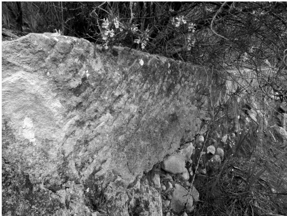
Figura 3: Secciones en arenisca que conforman parte del Caño de La Murta

de arenisca labrada, más o menos idénticas, de 1,20 m de largo, 0,25 m de ancho y 6,5 cm de ancho del labio (figura 3) 33 .