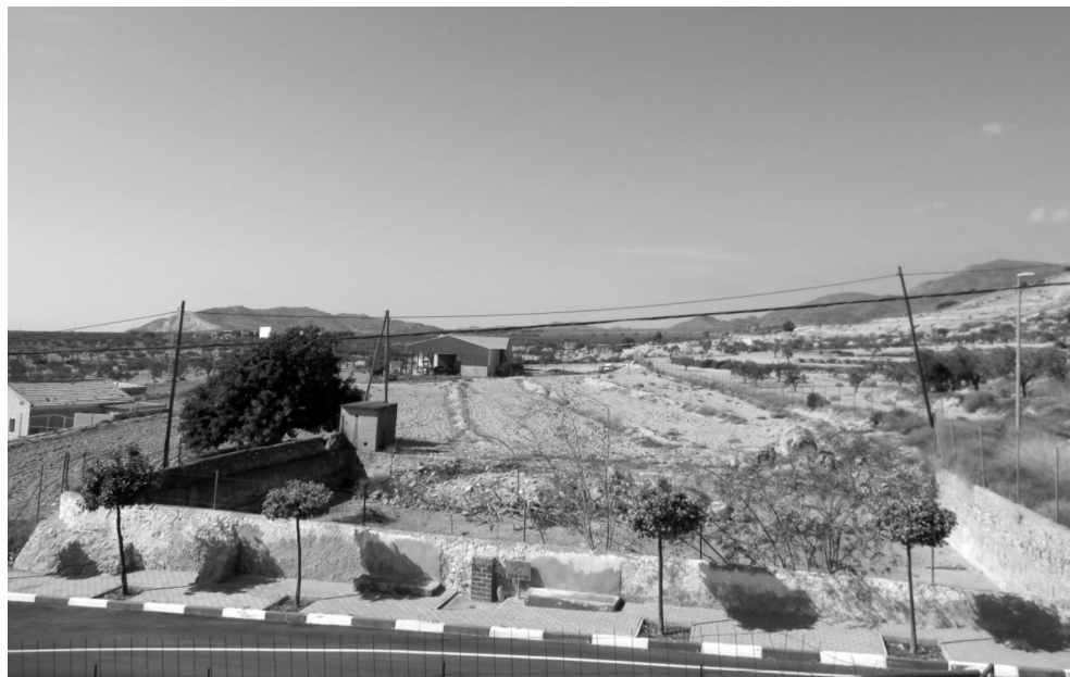
Figura 9: Balsa de La Murta

Tras los distintos elementos referenciados, integrados en la canalización, el final del sistema corresponde a la balsa localizada en el caserío de la propia población de La Murta (figura 9), en su sector oeste (X: 657422; Y: 4188460). Las dimensiones de esta infraestructura rectangular de almacenamiento son 25 m de largo por 20 m de ancho (500 m 2 ) y una profundidad de 2 m, lo que supone una capacidad de 1.000 m 3 .