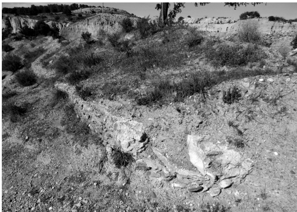
Figura 13: Restos del caño de la margen izquierda

En la margen izquierda de la Rambla de la Murta, a escasos metros aguas arriba de donde se localiza el puente de la RM-E5 que conecta Corvera con La Murta, se aprecian los restos de un caño de muros de 0,29 m y canal de 0,10 m de ancho 48 y 0,27 m de alto (figura 13). La obra está realizada mediante argamasa y piedra, apreciándose un enlucido del interior del canal, en el que, se observan concreciones calcáreas que corroboran el paso de agua por la infraestructura durante un tiempo prolongado, lo que quiere decir que esta estuvo en funcionamiento.