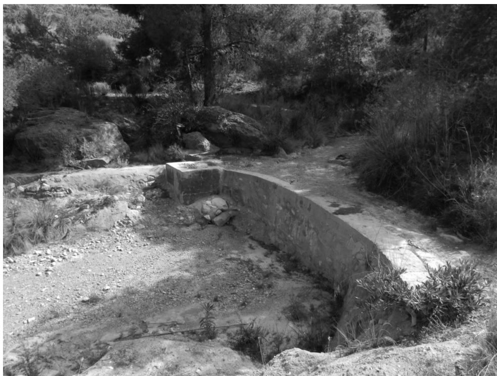
Figura 2: Presa de captación de las aguas subálveas de Caño de La Murta

estructura cuadrada que según los testimonios recogidos corresponde a la boca de un pozo moderno que se construyó con la intención de aprovechar la riqueza hidráulica del subsuelo en este lugar, una vez que el antiguo sistema dejó de ser funcional.