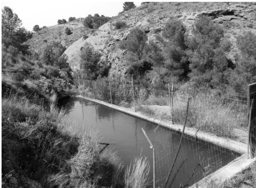
Figura 11: Balsa, llamada del «Tío Alonso», que acumulaba las aguas canalizadas

La balsa resulta ser una infraestructura hidráulica de morfología irregular (figura 11), con tan solo dos de sus paredes rectas, la del sur (3,50 m) y la del este que se alza sobre la rambla (14 m). Por otro lado, el muro del lado oeste (15 m), se adapta al terreno, conformando en su totalidad un cuarto de círculo aproximado de 30 m 2 . En la actualidad se encuentra llena de agua, lo que hace presuponer que aún mantiene una estanqueidad aceptable para su tarea, bien debido a su reparación o porque estructuralmente se conserva en buen estado.