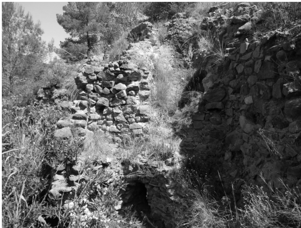
Figura 6: Vista interior del Molino de La Murta. En la parte inferior el saetín, en la zona media el cubo, con la pared frontal derruida, y en la parte superior el caz.

El grave estado en el que se encuentra el inmueble puede justificar una vida útil del mismo comprendida en un marco de tiempo lejano, siglos XVI-XVIII 40 , pudiendo ser desmantelada la maquinaria tras quedar en desuso. La inexistencia de molinos de viento en La Murta hace plausible esta afirmación, además del hecho de que los molinos eólicos de moler grano existentes en el entorno próximo de este núcleo fueron edificados a partir del siglo XVIII, como es el caso de los molinos de El Escobar (7,5 km) y Los Paganes (6 km) en el término municipal de Fuente Álamo de Murcia; o el de Valladolides (9,5 km) en el de Murcia. En este sentido, cabe decir que los vecinos entrevistados no recuerdan ver en funcionamiento el ingenio molinar, como tampoco recuerdan que sus antepasados citaran siquiera la existencia de la estructura molinar; todo lo contrario a lo que ocurre con la canali-