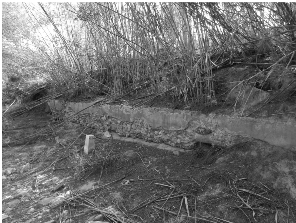
Figura 12: Restos del caño de la margen derecha

bajo. Cabe la posibilidad de que este hecho se deba, en parte, a la captación directa de agua procedente de avenidas, aunque no se ha constatado la existencia de una toma de derivación. Los restos materiales permiten señalar que se trata de una infraestructura hidráulica considerable y de buena factura. En este sentido, en los primeros metros de la canalización, localizados al mismo nivel que el propio lecho de la rambla, se realizó una tarea nivelación sobre la que se construyó el caño en obra de mampostería, fragmentos de roca y argamasa, enluciendo sus muros con mortero de grano fino. Más adelante, la obra gana altura con respecto al nivel de base de la rambla, alzándose sobre las paredes del margen derecho del cauce, si bien el canal mantiene su leve pendiente constante que permitía la movilización de los caudales captados hasta un lugar indeterminado que bien pudiera ser la propia población de La Murta o incluso la balsa existente en la localidad.