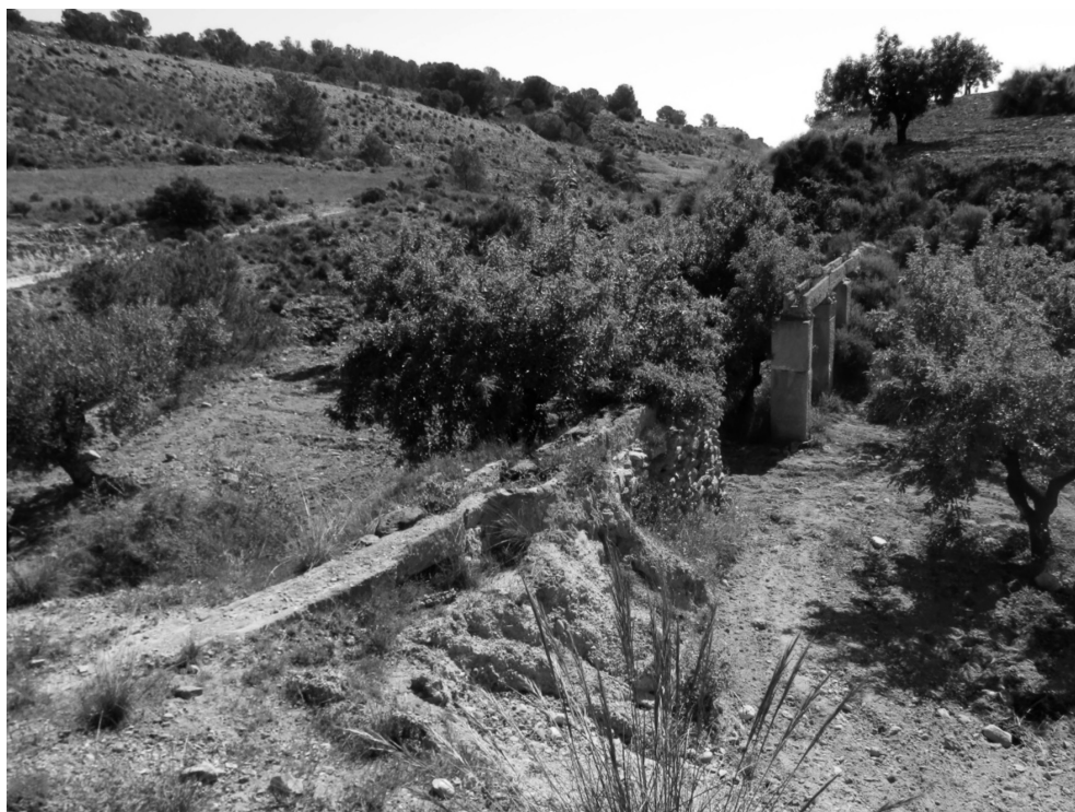
Figura 8: Acueducto de secciones talladas y bloques de arenisca del Caño de La Murta

da mediante segmentos de caños de arenisca de longitudes dispares (figura 8). En total, el acueducto supera los 20 m de longitud, mientras que la altura máxima que alcanza en el punto central de la obra es superior a los 2,15 m. No obstante, cabe decir que parte del acueducto se encuentra desmontado para facilitar el laboreo de la parcela en la que se encuentra.