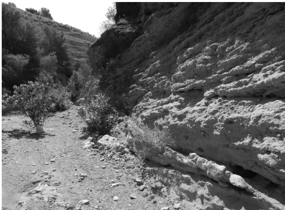
Figura 10: Tramo de caño tallado en la roca de la margen derecha

El citado arranque del sistema resulta un tanto incierto, pues no existe presencia alguna de presa subálvea o boquera de derivación que pueda hacer pensar en alguno de estos sistemas de captación de aguas. De este modo, únicamente quedaría la opción de la toma directa de las aguas en el cauce de la misma rambla, bien en episodios de avenida, bien de manera más o menos constante si el lecho disfrutaba antaño de un caudal continuo aunque fuese escaso.