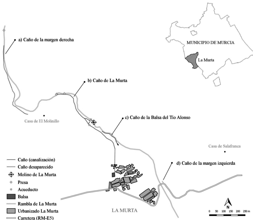
Figura 1. Localización de las estructuras hidráulicas respecto a la localidad y la rambla

presencia de tierras potencialmente cultivables en el entorno de la fuente, conformaron una dupla atractiva y valorada para la población desde épocas remotas, lo que propició la creación de aterrazamientos en el marco geográfico anexo tanto a la rambla como al núcleo habitado, en muchos casos originados a partir de la eliminación de la cubierta vegetal propia de su condición de territorio próximo al macizo de Carrascoy.