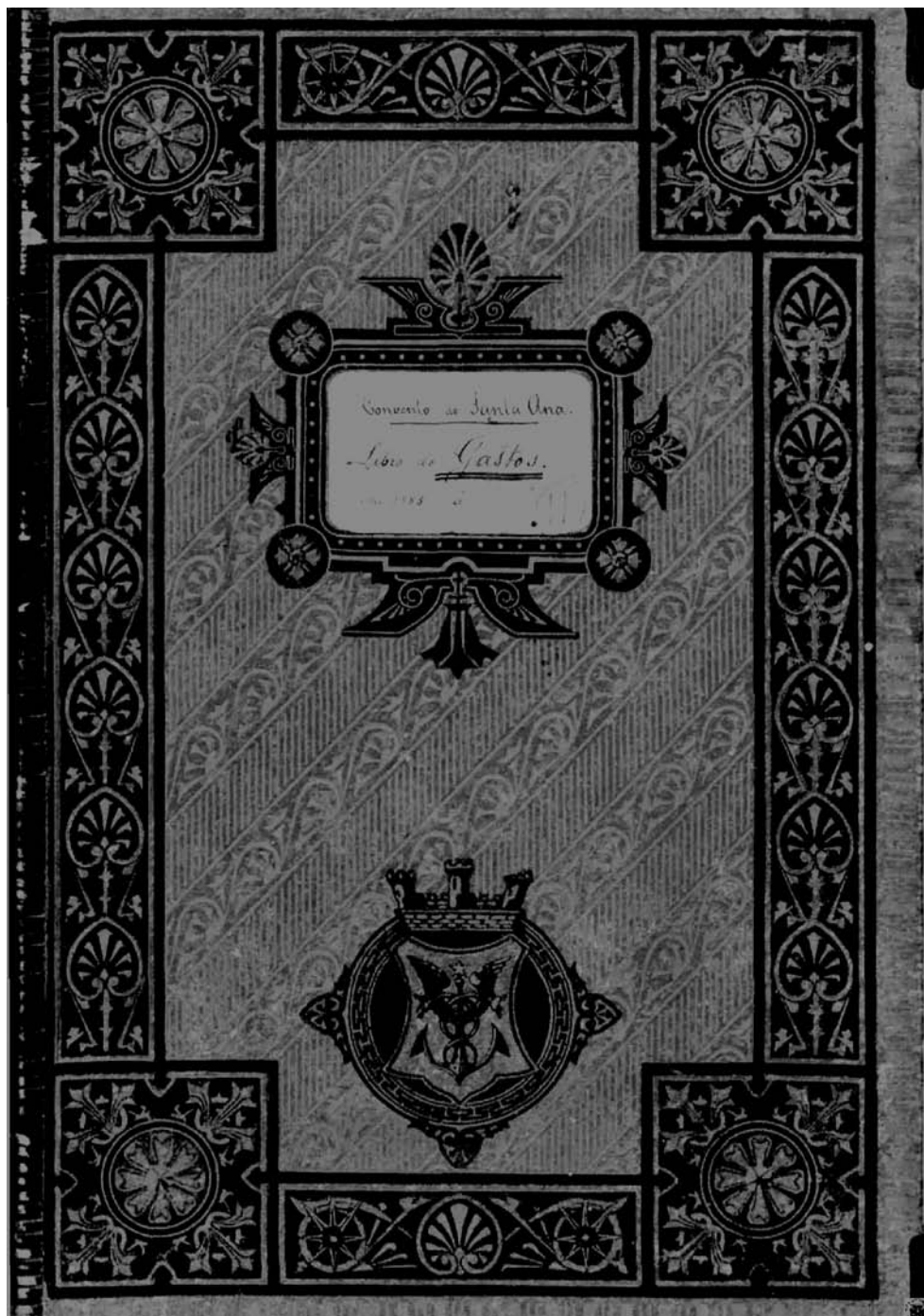
Fig.2. Libro del Gasto Ordinario Mensual del Convento (1885-1892), portada (AMSAM,C.18,D.4)