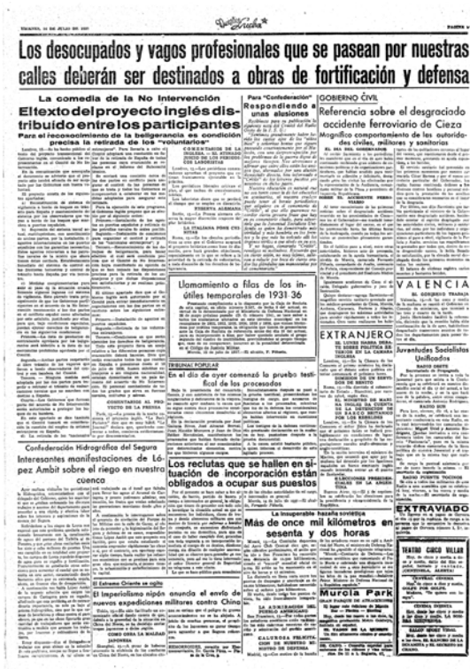
Periódico, NUESTRA LUCHA

realizando gestiones telefónicas para coordinar los servicios sanitarios. Aunque al lugar había acudido ya personal sanitario diverso y fuerzas de Asalto, se recabó de los pueblos inmediatos cuanta ayuda pudiesen prestar, y aún a los de la ciudad de Murcia.