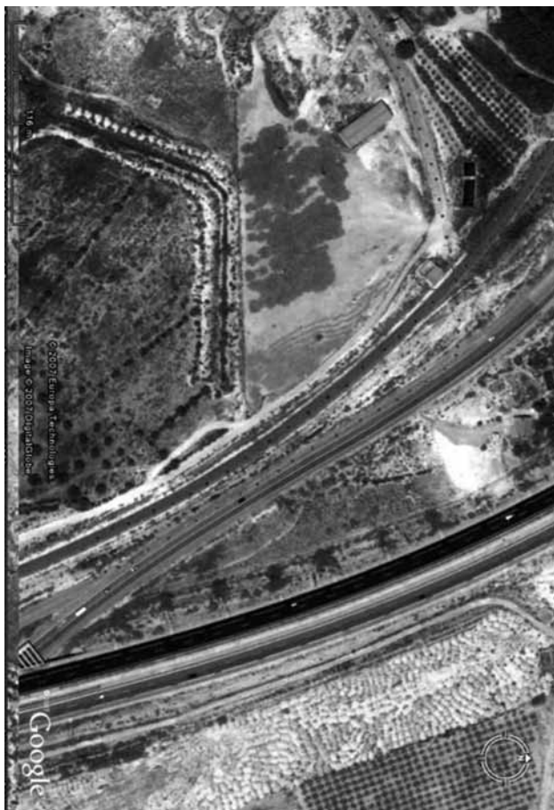
Los Prados (Cieza). Lugar del accidente

del Sol (actualmente principio de Ramón y Cajal), como era de noche y el alumbrado público tampoco era bueno por la precariedad impuesta por la guerra, el conductor confundió la ruta a seguir, encaminándose en dirección a la bajada recta, hacia la Cuesta de la Villa, aunque aquel soldado conductor, de puro milagro pudo hacerse con el volante a tiempo y doblar la curva, librándose por centímetros de estrellarse en la acera de enfrente o en las casas de abajo. Por lo que si el camión, con exceso de velocidad y su peligrosa carga hubiera explotado en este lugar, y dada la avanzada hora de la noche, cuando muchas familias ya se encontraban en sus casas, la mayoría en la cama, entonces hubiera sido una verdadera catástrofe. Pero gracias a su habilidad se salvaron muchas vidas. En cambio, la suya la prolongó unos momentos solamente, porque la suerte ya estaba echada y minutos más tarde, camión, conductor y acompañante, volaría por los aires hechos añicos.